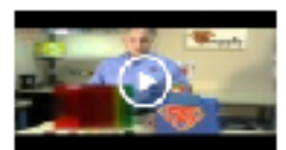
Gauge Marking Views : 30